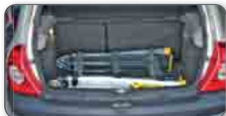
"Transport dans un petit véhicule" TT3

ULTRA-COMPACTES pour transport et stockage aisés.