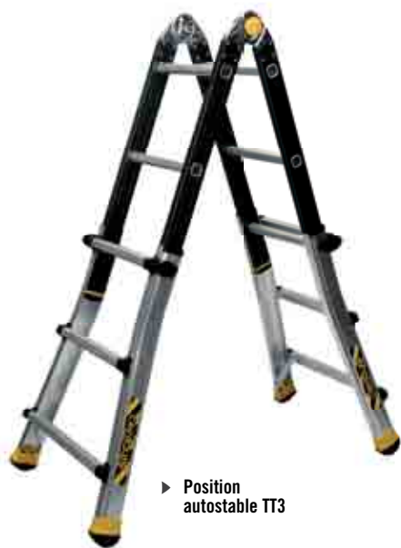
► Position autostable TT3

Téléscopiques 4 x 3 barreaux et 4 x 4 barreaux