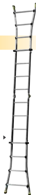
Position échelle simple