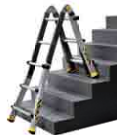
► Position en dénivelés