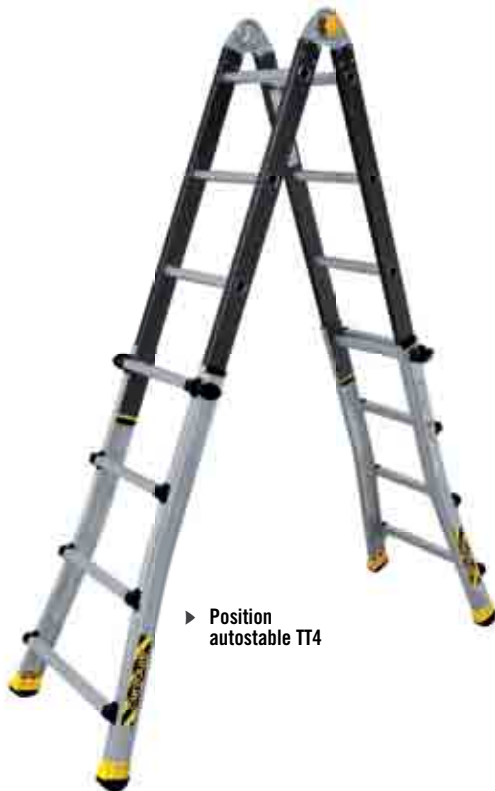
► Position autostable TT4