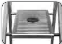
Plate-forme ultra-spacieuse. Dimensions 400 x 275 mm.

2 rampes d'accès en acier traité. Longueur : 430 mm 1 et 730 mm 2