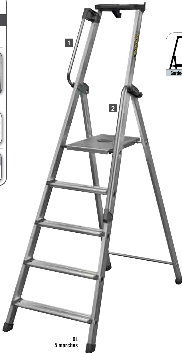
XL 5 marches

Testé dans les conditions définies par le paragraphe 5.8 de la norme EN 131.