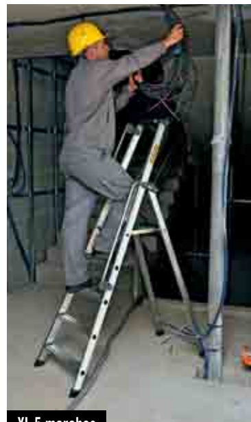
XL 5 marches