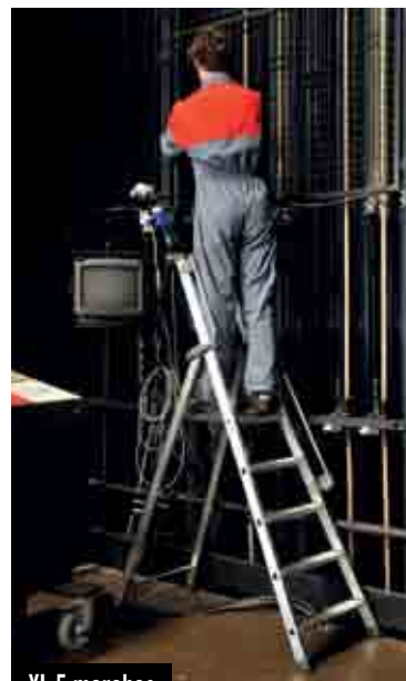
XL 5 marches